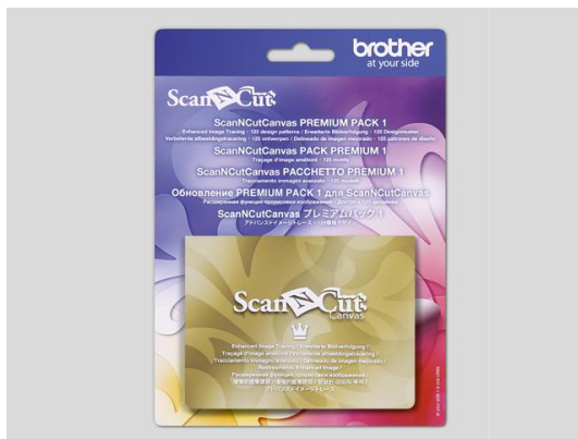
Mustersammlerkit 1 (125 Designs)