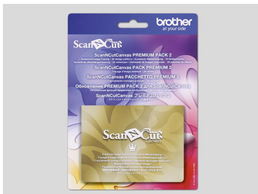
Mustersammlerkit 2 (25 Designs)