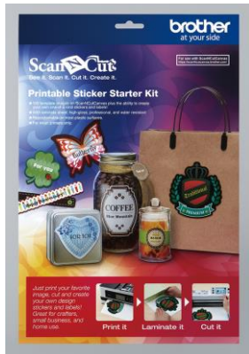
Starterset für Bedruckbare Etiketten

Diese hier sind die bereits erschienenen Startersets, die schon vorher erhältlich waren: