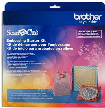
Embossing Starter Set