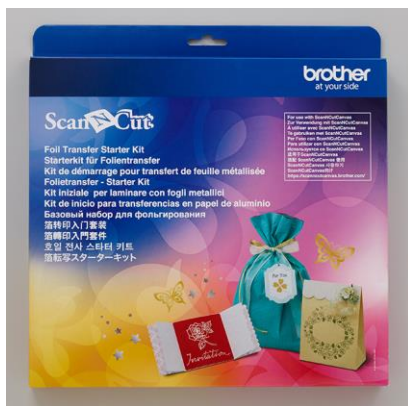
Starter Set für Folientransfer