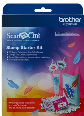
Starter Kit für Stempel